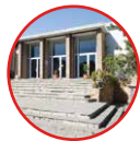
03 Coma-ruga Xanascà