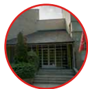
05 La Seu d'Urgell Xanascà