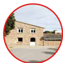
06 L'Escala Xanascà