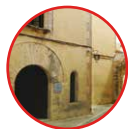
01 Altafulla Xanascà