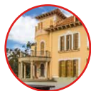
02 Cabrera de Mar Xanascà