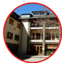
04 La Molina Xanascà